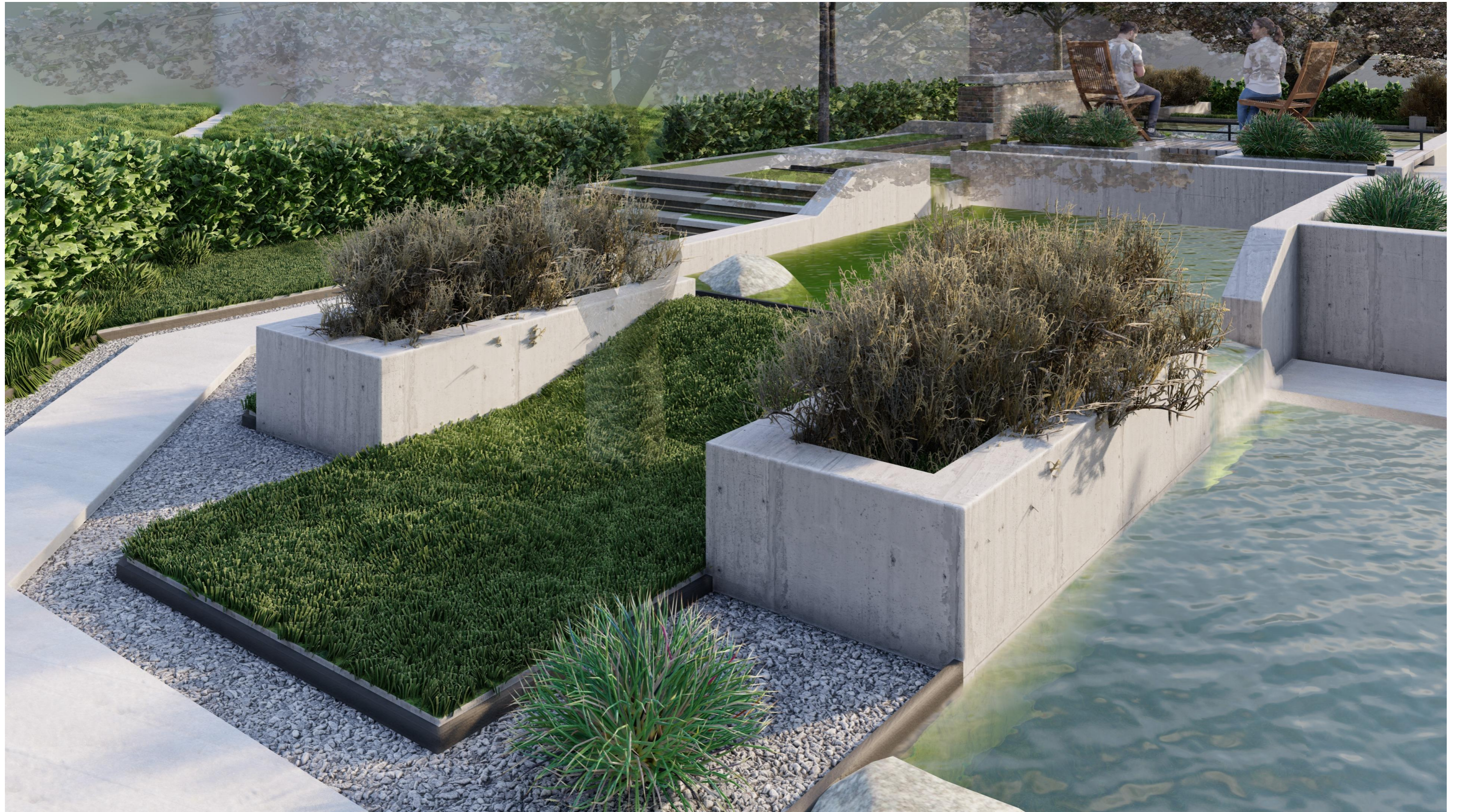
П-подібний елемент при 2-му ставку. Ракурс 1