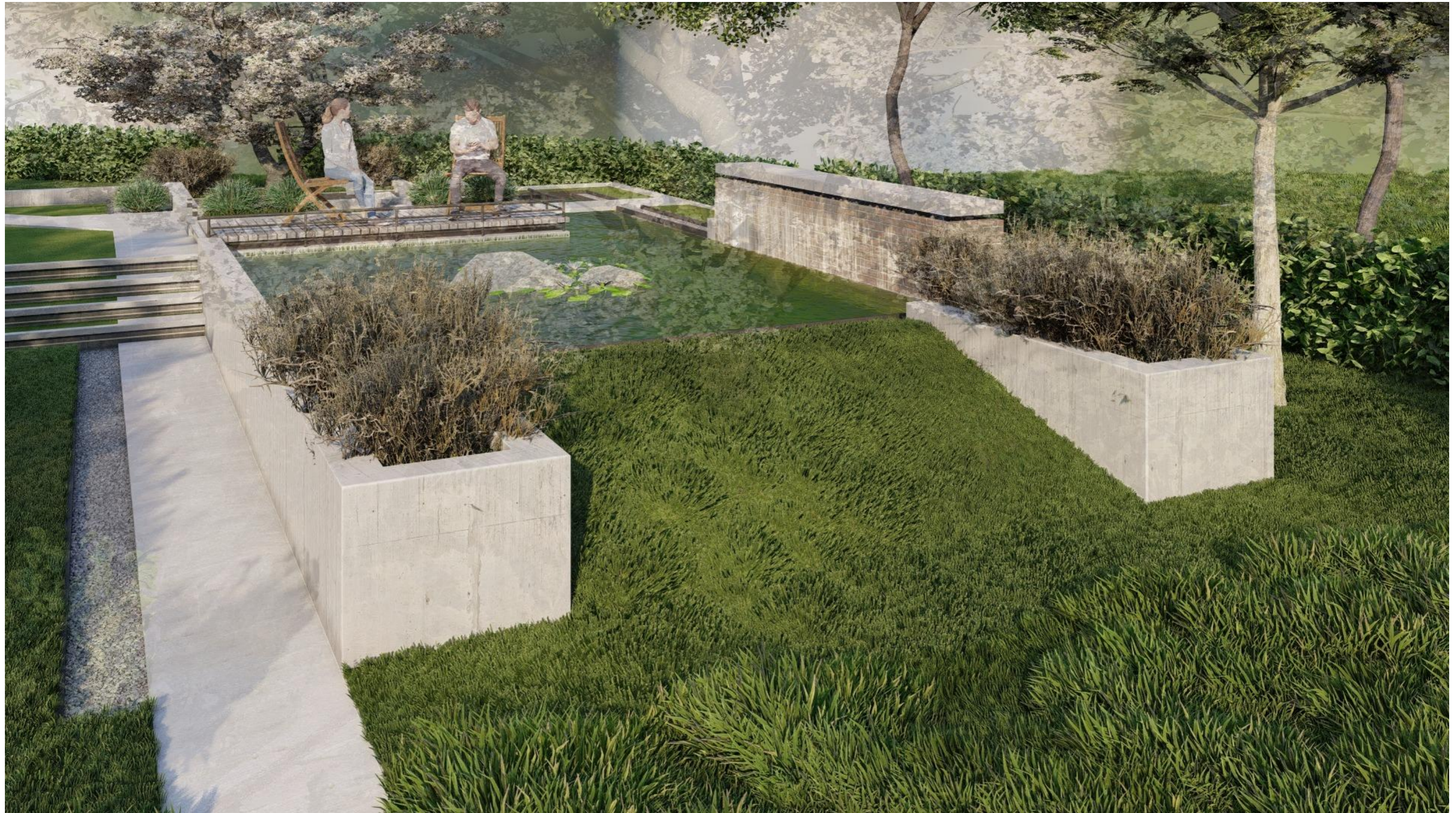
П-подібний елемент при 1-му (верхньому) ставку. Ракурс 1