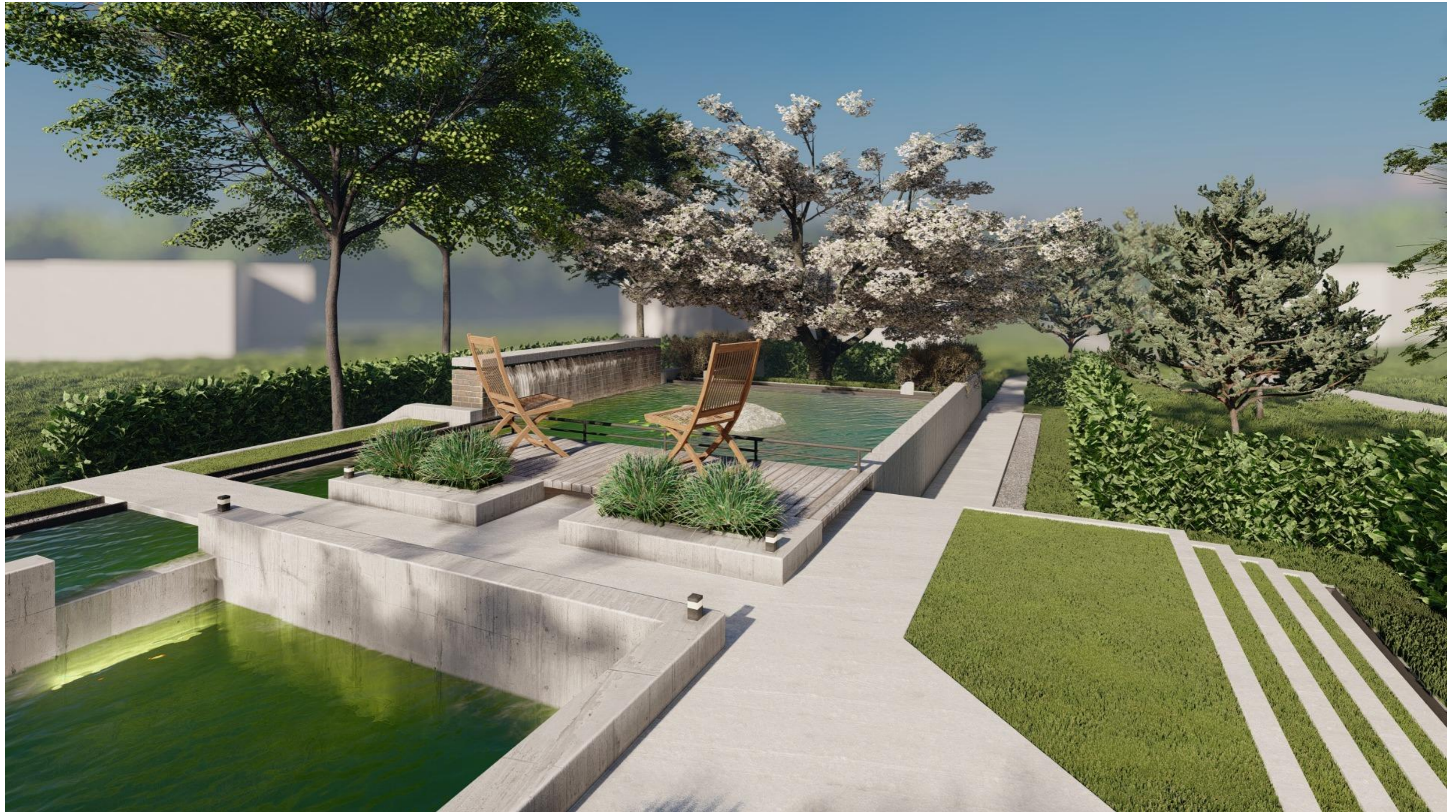
Перший ставок каскаду