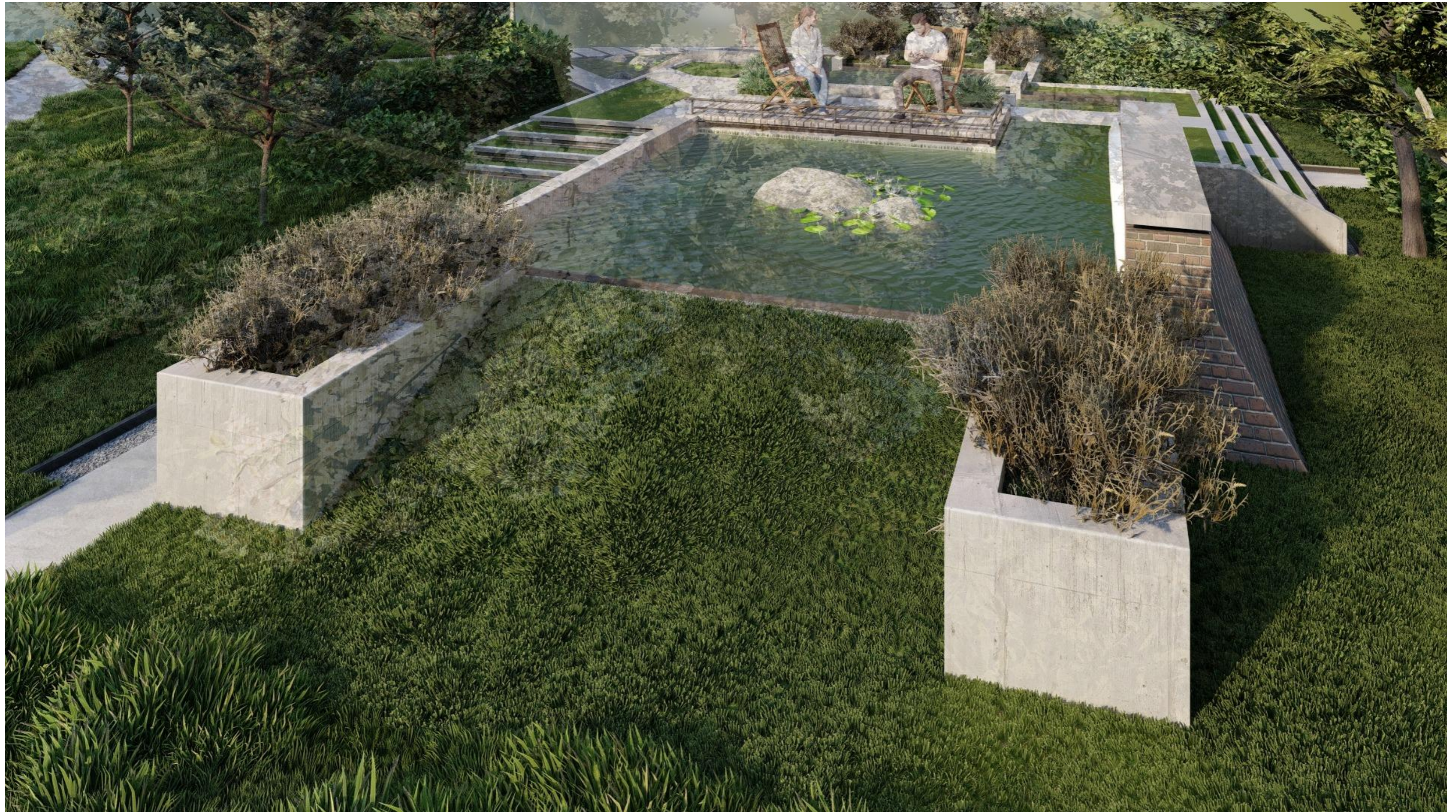
П-подібний елемент при 1-му (верхньому) ставку. Ракурс 2