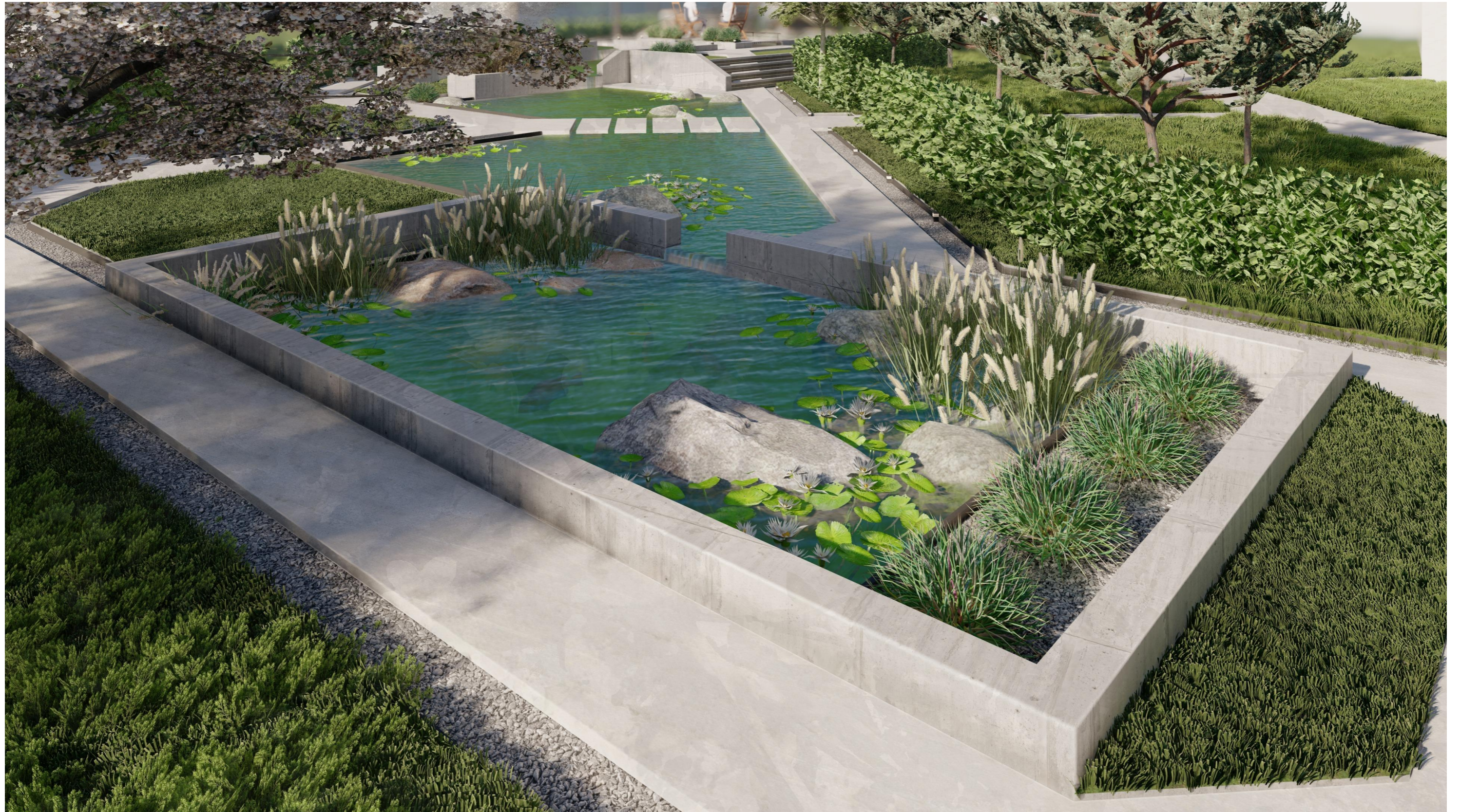
Останній ставок каскаду. Ракурс 1